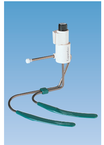
ラパロファン™ "J" ライト型