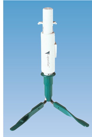
ラパロファン™ 10cm (腹部用)