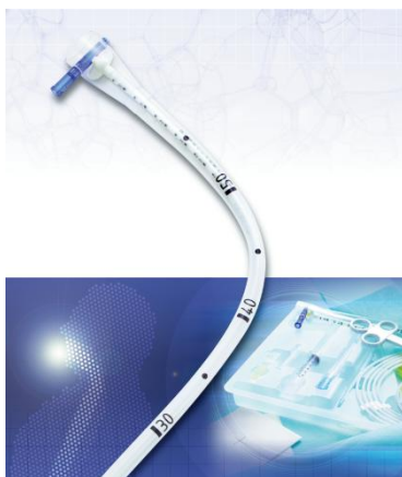
■カンガルー™PEG キット(ニュートレックス™S)