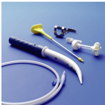
■カンガルー™セルジンガーPEG キット